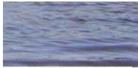
Артем Лисочкин