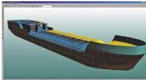
Рис. 1 Система Nupas-Cadmatic Hull Viewer

Международная кооперация для России уже не миф, а текущая реальность. Электронная почта не вызывает удивления и даже в глубинке сложно найти верфь, службы которой не имели бы доступа в интернет. При работе с иностранными партнерами нормой стала графика и цифры, позволяющие избежать двоякого толкования мысли, выраженной на смеси английского с нижегородским.